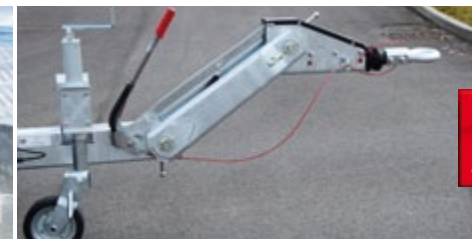
Timon réglable parallélogramme surbaissé OPTIMA