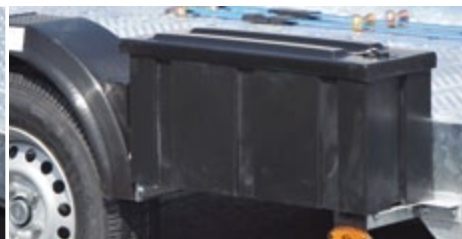
Coffre de rangement