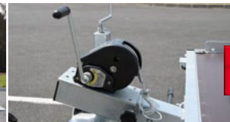
Support de treuil et treuil manuel