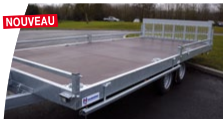
Galerie rabattable latéralement