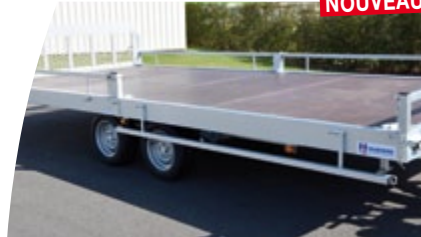
Galerie rabattable latéralement