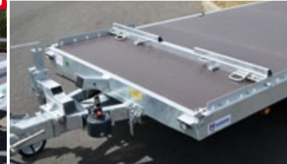
Cale de roue réglable