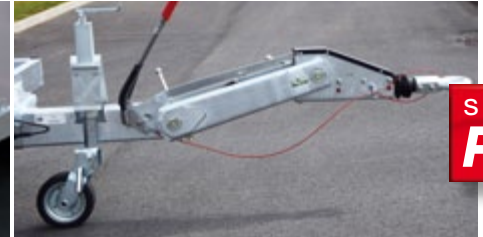
Timon réglable parallélogramme surbaissé OPTIMA