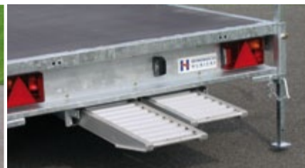
Logement de rampes, rampes, béquilles