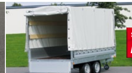
Ridelles aluminium et bâche haute