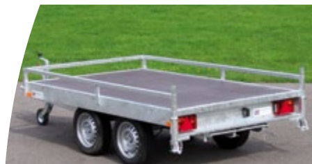
Galerie 3 faces

En plus de leurs qualités techniques, ces remorques proposent en série un plancher bois antidérapant, une flèche en V et un éclairage encastré. Cette gamme propose de nombreuses options (ridelles aluminium rabattables et amovibles, bâche haute, galerie, rampes...).